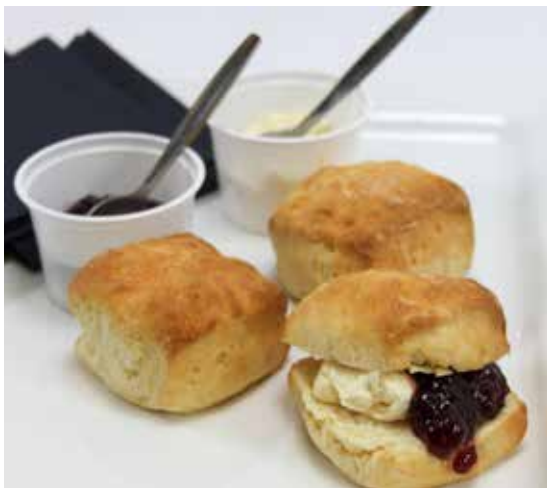
SCONES MET JAM EN ROOM PER STUK € 2,00